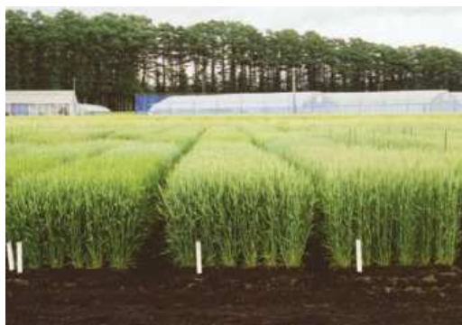
③「もち姫」の圃場での穂揃期の草姿