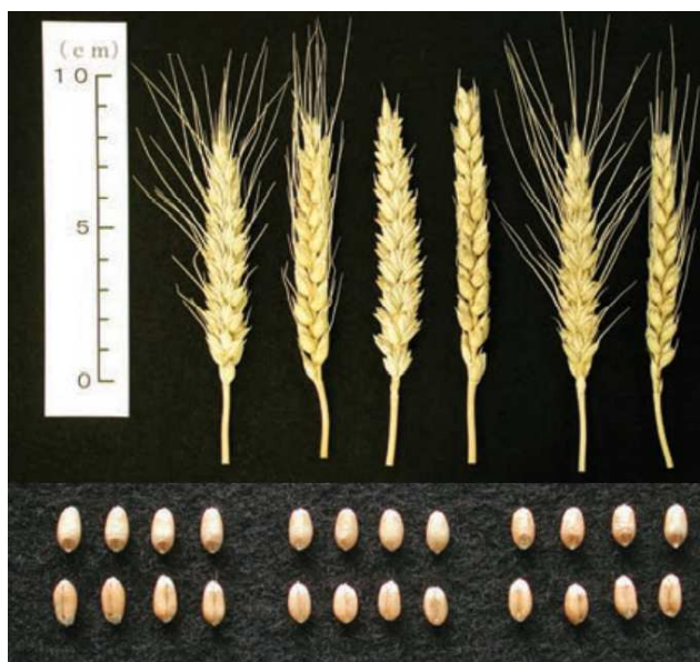
②「もち姫」の穂（正面、側面）と子実