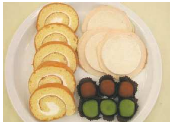
④「もち姫」を利用した加工品