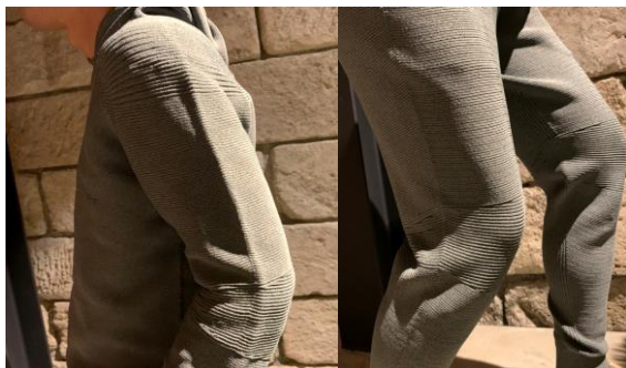
3D立体型編成ニット